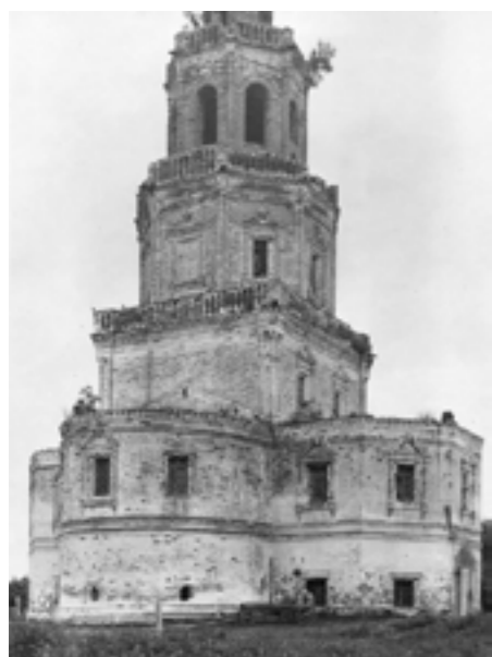
Церковь Вознесения в с. Сенницы, 1954 г.

«Десница Господня касается того, кто строит храмы, и многие грехи простит тому Господь». преп. Серафим Саровский