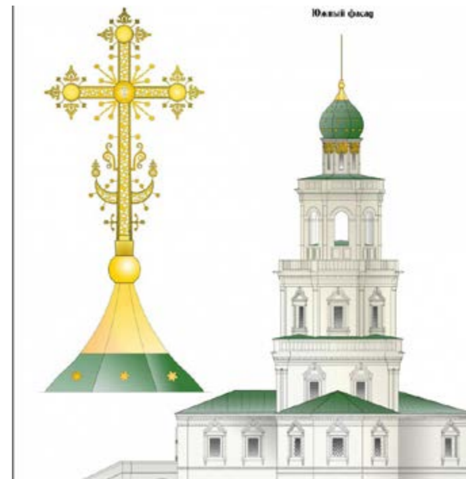
Так будет выглядеть храм после реставрации

Храм Божий для верующих людей – светлое место. Сюда мы приносим и радости, и скорби, и страдания, полагая их к пре- столу Божию. Сегодня вера даёт нам силы поднимать из руин по- руганные святыни. Люди в пока- янии и молитве находят дорогу к православному храму, к истин- ной вере своих отцов и дедов. То, что Святая Русь росла и раз- вивалась на основах Правосла- вия, должны знать и грядущие поколения.