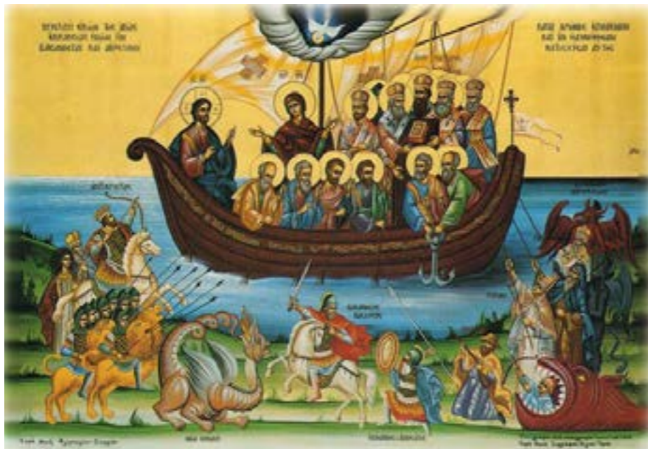
Аллегорическое изображение Церкви в виде корабля

Для чего христианину нужно каждое воскресенье ходить в храм на Литургию, ведь Бог везде слышит наши молитвы? Так почему бы не остаться в утро выходного дня дома?.. Известный миссионер, священник Даниил Сысоев, оставил нам свои ответы на эти вопросы.