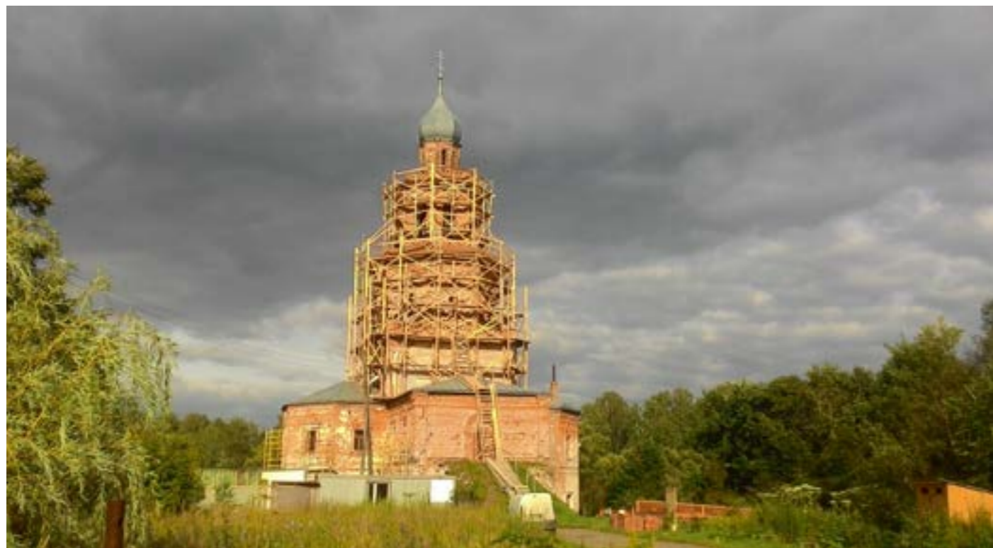
Начало реставрационных работ в храме Вознесения Господня (село Сенницы)

Новые времена меняли и сельские приходы - не стало барина, вотчинной конторы, сословных ограничений. Выборная волостная власть оказалась в руках сельской верхушки, зажиточно-