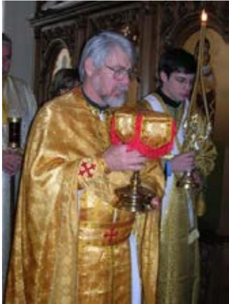
Литургия в православном храме св. Антония Великого, Техас

Пастор-баптист делится впечатлениями о православной литургии